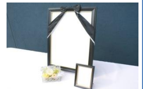
骨壺 自宅用仏具 ご遺骨用祭壇 消耗品類 カラー遺影写真