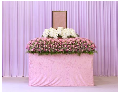
花祭壇 A タイプの場合