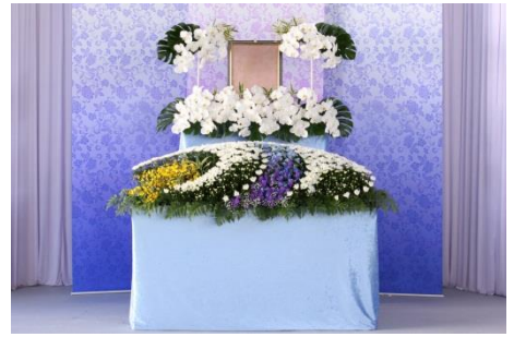
花祭壇 B タイプの場合