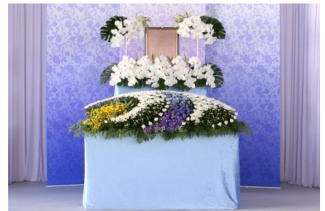
花祭壇 Bタイプの場合