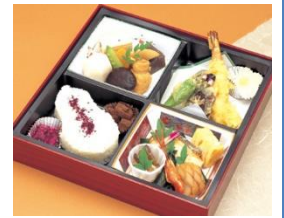
通夜料理 100名様対応分 寿司・揚げ物・煮物・香の物 ※握り寿司のプランもあります 告别式お膳 25名