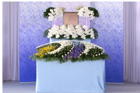
花祭壇 B タイプの場合