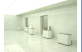
返礼品 100セット 布張りお棺 寝台車 二回 新館 式場費 2間 火葬料