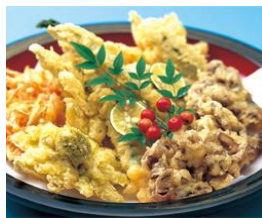
寿司・揚げ物・煮物・香の物