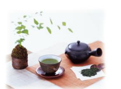
返礼品 75 セット