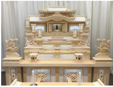
白木祭壇の場合 704,500 円 税別