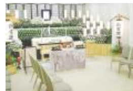
新館 式場費 2 間